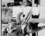
Bonnie & Clyde