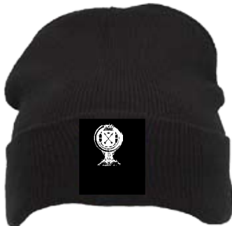
Svart toppluva med guldbrodyr